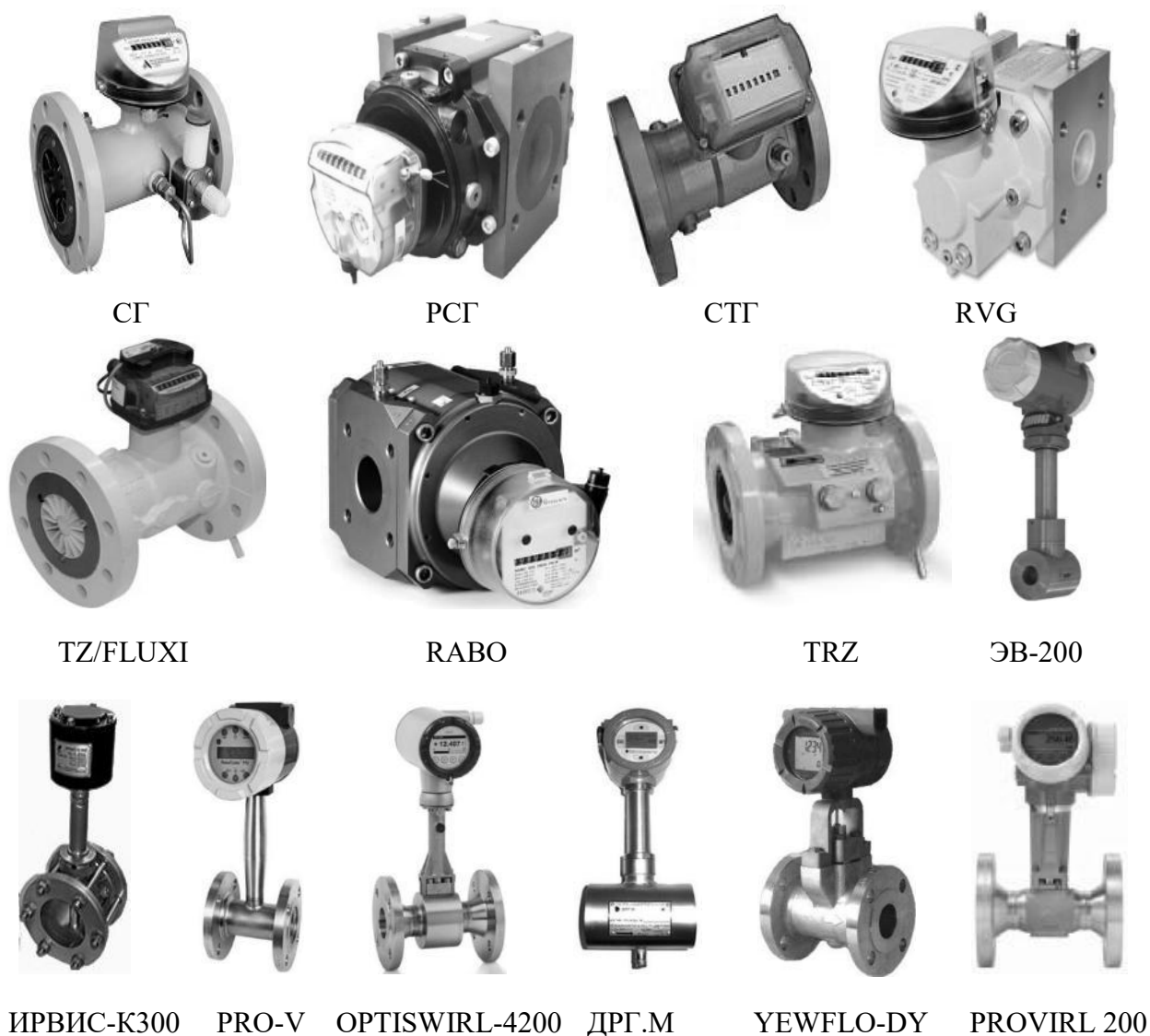
Рисунок 3 – Преобразователи расхода