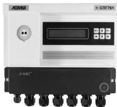
Рисунок 1 – Корректор СПГ761 (СПГ762)

Общий вид составных частей ИК приведен на рисунках 1 – 6.